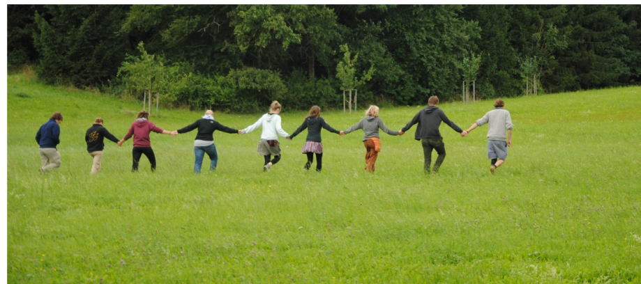
BEI DER W 3 2014 AUF SCHLOSS TEMPELHOF