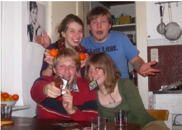
Beim Treffen in Hannover