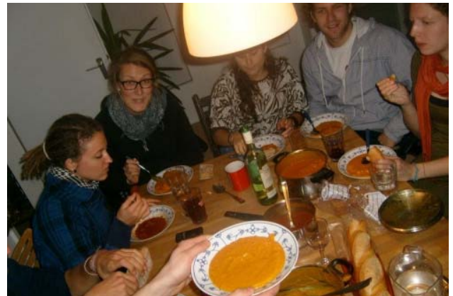
Suppe: Regionalgruppentreffen NRW in Köln.