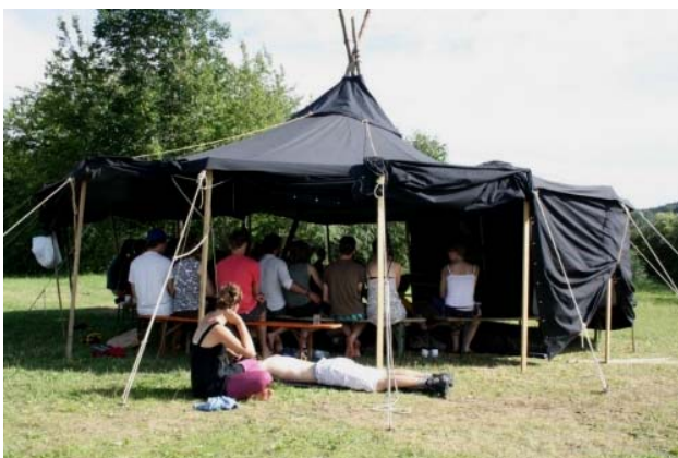
Vortrag in einer Jurte während des ETs 2011

Auch in diesem Sommer soll selbstverständlich ein Jahrestreffen veranstaltet werden! In einer Abstimmung haben sich die Mitglieder für W 3 - weltweiterwerkstatt als neue Bezeichnung des Treffens ausgesprochen. Nun gilt es die erste W 3 zu planen. Wir bauen auf Deine tatkräftige Mitarbeit!