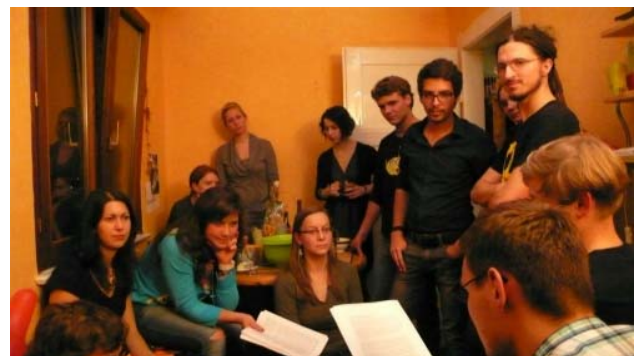
& Musik: in Stuttgart wird musiziert.