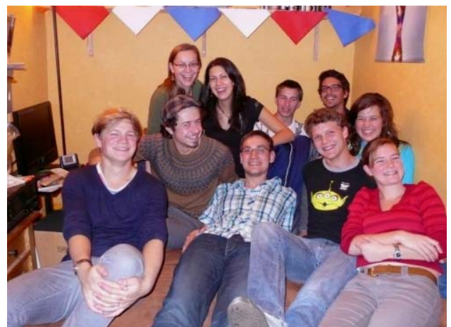
Regionalgruppentreffen in Stuttgart